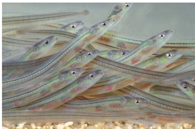
Alevins d'anguille ou "civelles"

Le chapitre de la Liste rouge nationale consacré aux poissons d'eau douce de France métropolitaine a été élaboré par le Comité français de l'UICN et le Muséum national d'Histoire naturelle, en partenariat avec la Société française d'ichtyologie et l'Office national de l'eau et des milieux aquatiques. Cette analyse permet de déterminer le degré de menace qui pèse sur chacune de ces espèces sur le territoire métropolitain. On entend ici par poissons "d'eau douce" toutes les espèces qui effectuent au moins une partie de leur cycle de vie en eau douce, pour leur croissance et/ou pour leur reproduction.